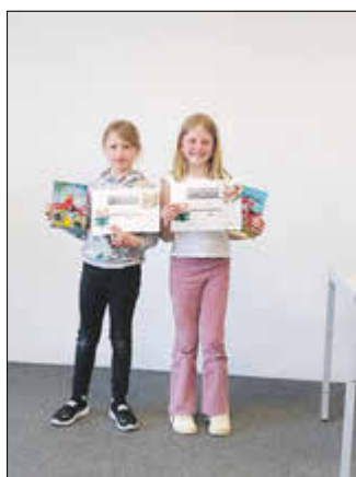
Leseköniginnen Klasse 2