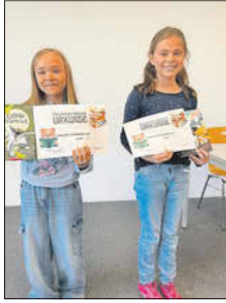
Leseköniginnen Klasse 4

Somit durfte die große Jury, bestehend aus zwei Schülern, einem Praktikanten, einer Erzieherin, der Schulleitung und Herrn Ritter vom Rotary Club, den Lesevorträgen von sieben Leseköniginnen und einem Lesekönig lauschen. Die Entscheidungen fielen nicht leicht, denn alle acht Kinder