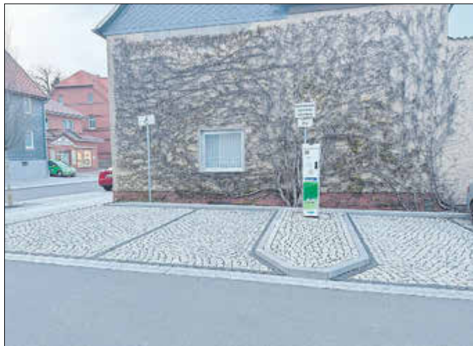
Parkflächen für Elektroautos im Ladevorgang (rechts und links neben der Ladesäule)