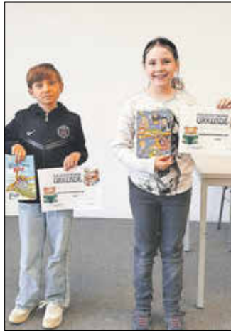
Lesekönig und -königin Klasse 3