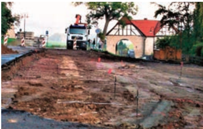
Das nördliche Fundament vom ehem. Schafstall, am 13.09.2012 freigelegt. Im Hintergrund das Torhaus.