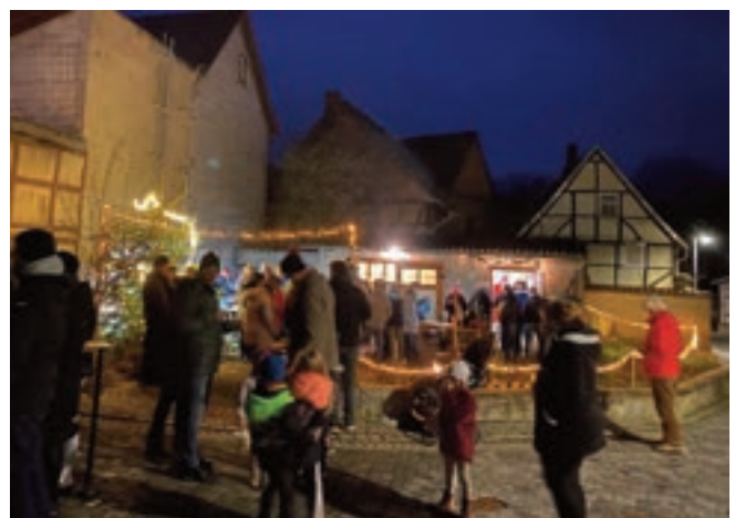
Ein Adventsfenster im Jahr 2022