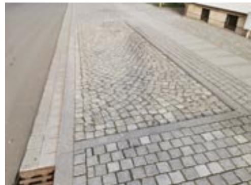
(Hauptstraße, Fahrtrichtung Gernrode)

Nachfolgend wird in Form von Bildern noch einmal ein kurzer Überblick gegeben, der verdeutlichen soll, wo geparkt werden darf und wo nicht.