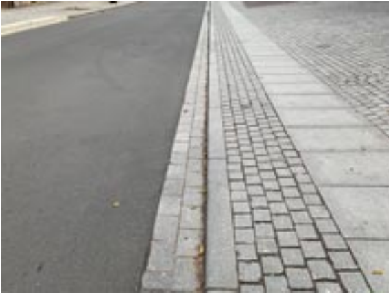
(Hauptstraße, Fahrtrichtung Gernrode)