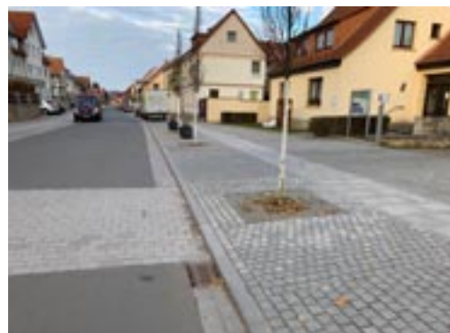
(Hauptstraße, Fahrtrichtung Gernrode)